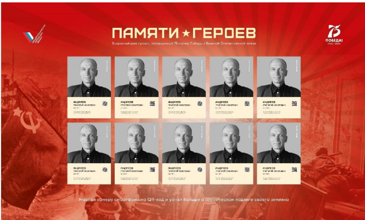
Рис. 5. Тематический стенд, на котором ежемесячно обновляется информация о героях