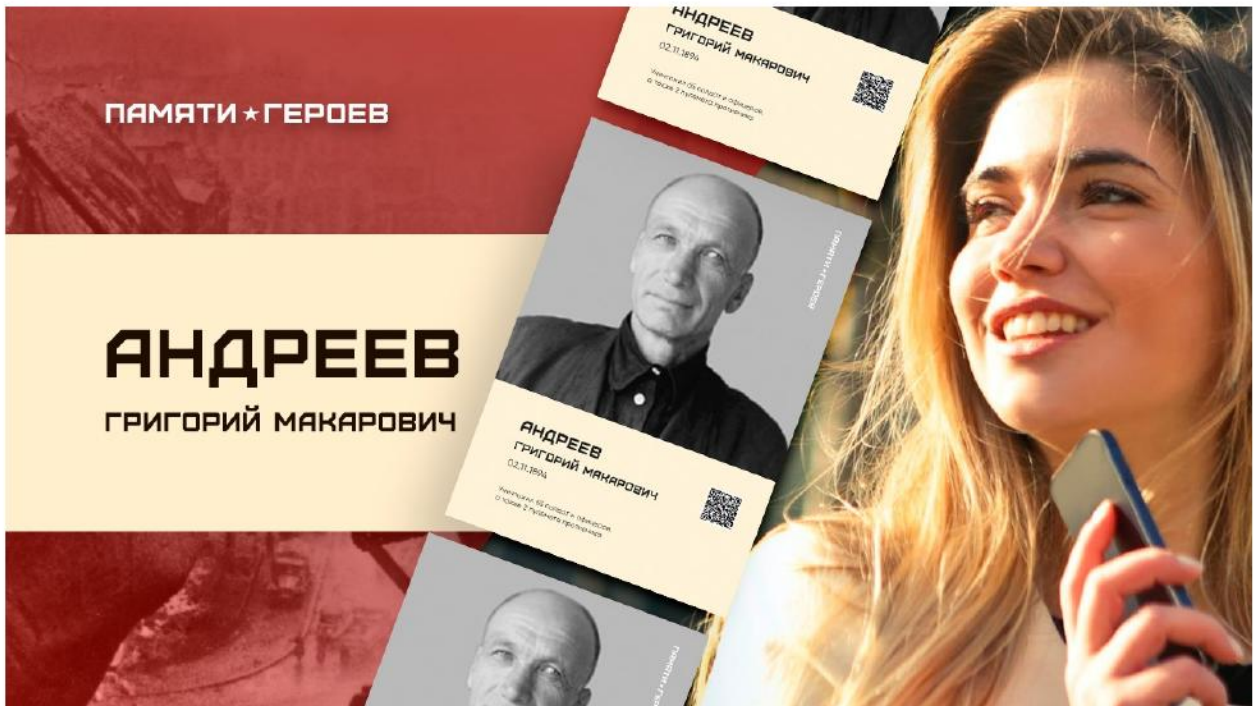
Рис. 3. Образец превью на загружаемый ролик о Герое. Шаблон .psd во вложении.